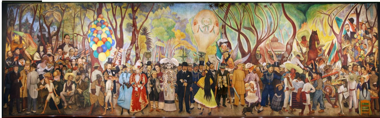
“Sueño de una tarde dominical en la Alameda Central”: Mural by Diego Rivera

Diego Rivera: Famous Mexican painter known for his murals