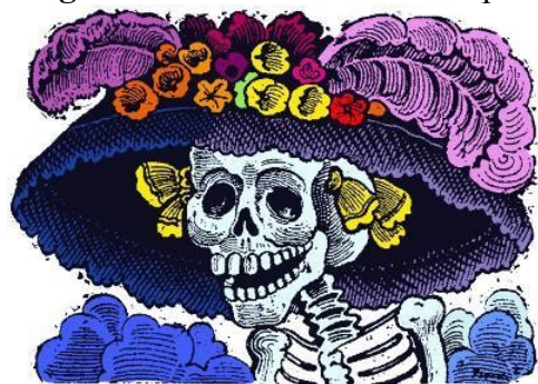
“Calavera de La Catrina” – by José Guadalupe Posada

Diego Rivera: Famous Mexican painter known for his murals